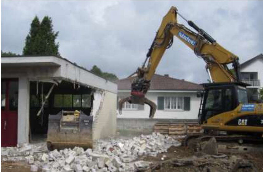
Abbrucharbeiten im Mai 2014

An den Winterversammlungen 2013 der Gemeinden Niederwil und Fischbach-Göslikon wurde der Baukredit über Fr. 2.7 Mio. (brutto) für den Neubau des gemeinsamen Feuerwehrgebäudes von der Bevölkerung gutgeheissen. Am 5. Mai 2014 erfolgte der Baustart für das neue Feuerwehrgebäude. Der Bau konnte Ende 2014 von der Feuerwehr in Betrieb genommen werden. Die Einweihungsfeier ist im Mai 2015 geplant.